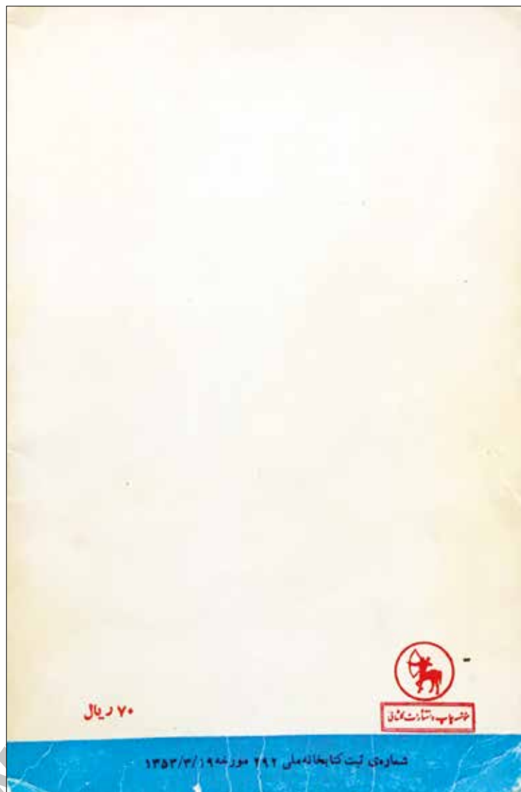
پشت جلد، چاپ اول