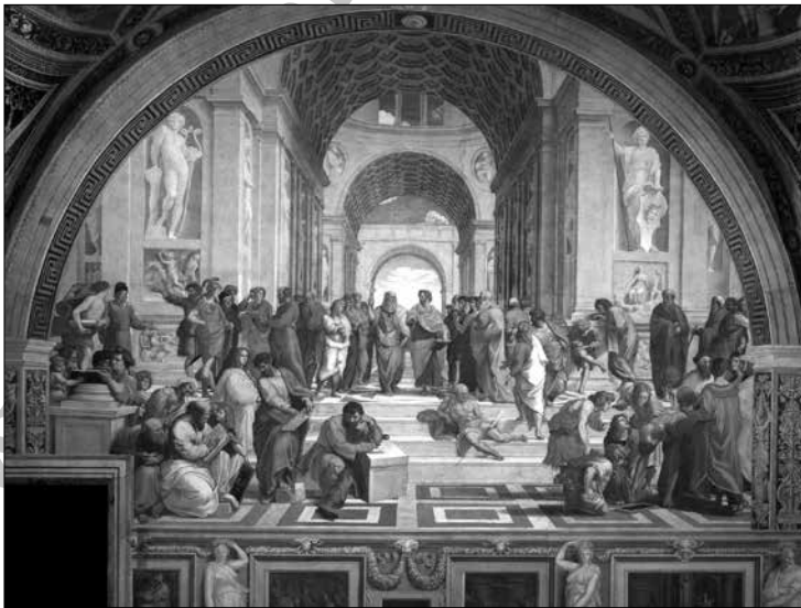
زرتشت در میان فیلسوفان یونانی در آتن، اثر رافائل نقاش ایتالیایی

نخست آن که قبل از این که به این واقعیت برسیم، باید ببینیم در طول تاریخ چگونه فرهنگ، علم و دانش ایرانی توسط بیگانگان اکتساب و به نام خودشان ثبت شده؟: اگر امروز کشورهای متمدن و با فرهنگ جهان، اصول زندگی شان روی "عقلانیت و خرد و خردمندی" می چرخد و بدین وسیله تولید علم و صنعت می کنند، بنا بر این اصل باید ببینیم بن پایه این "خرد" از کجا و در چه زمانی، از جانب چه دانشمندی